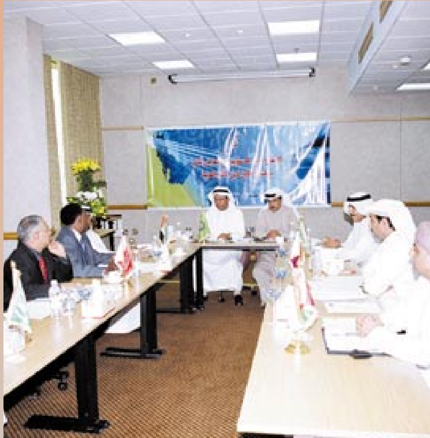
اجتماع مديري معارض الكتب الخليجية